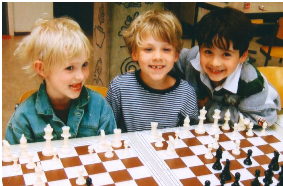
De jeugd begint steeds jonger met het leren van schaken