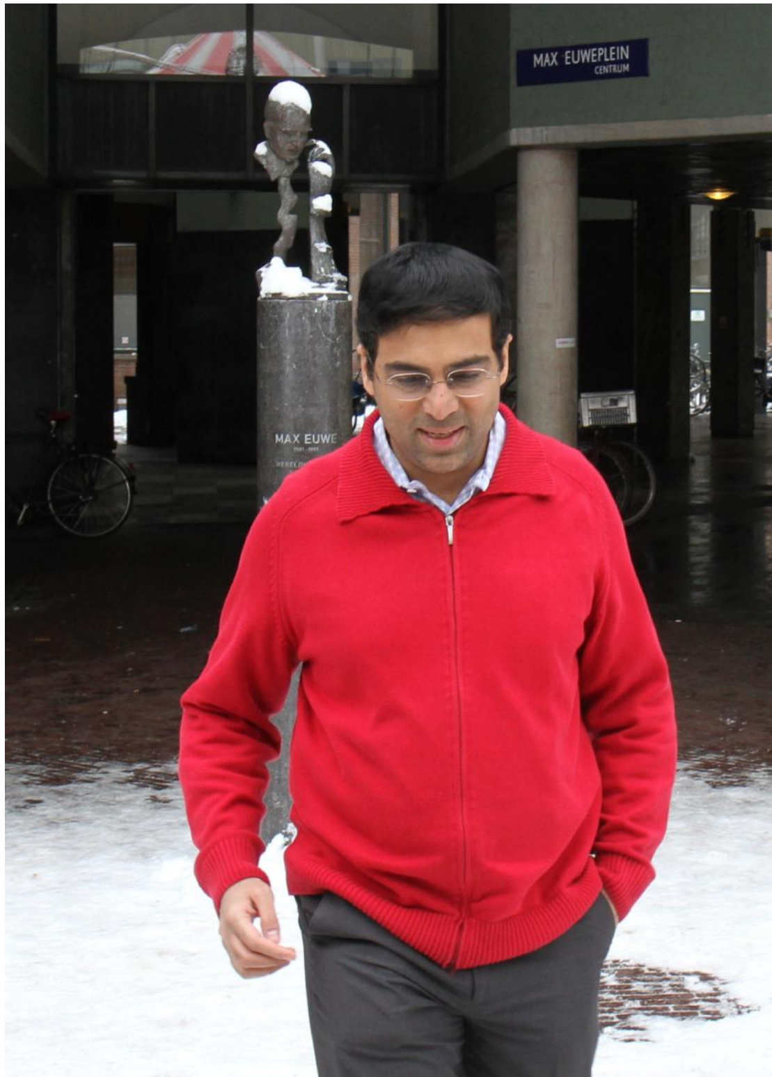
Wereldkampioen Anand stapt door de sneeuw naar de feesttent (17 december 2010)